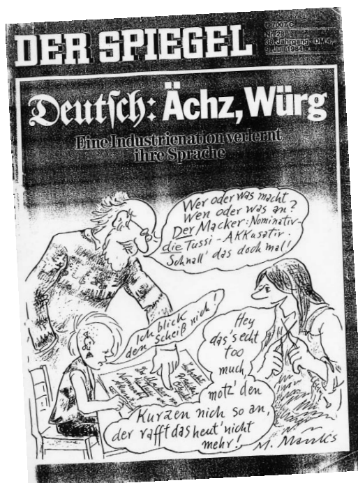
„Spiegel“-Titelblatt vom 9. Juli 1984

Im Folgenden werden einige Thesen zum Verhältnis von Jugendsprache und Mediensprache aus sprachwissenschaftlicher Perspektive zur Diskussion gestellt. Aus der Sicht von Medienvertretern steht Jugendsprache oft im Zentrum von Sprachkritik. Dabei bleibt zumeist unberücksichtigt, dass einerseits die Mediensprache einen wichtigen Einflussfaktor für die Bildung jugendlicher Sprachstile darstellt und dass andererseits Ausdrucksweisen Jugendlicher von den Medien für bestimmte Zwecke vereinnahmt und stilisiert werden. In den Medien wird oft das kritisiert, was zuvor selbst erzeugt wurde: eine medial konstruierte „Jugendsprache“. Im Rahmen des Prestigefaktors Jugendllichkeit überschreitet Jugendsprache als Medienphänomen Grenzen zwischen Generationen sowie individuellen Entwicklungsphasen.